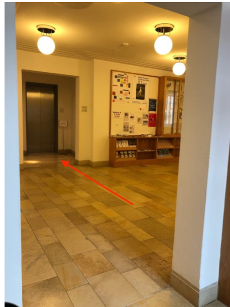
Blick aus Aufzug 1 in das obere Foyer „Zur Ausstellung“