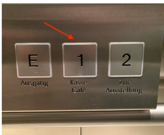
Tasten in Aufzug 1