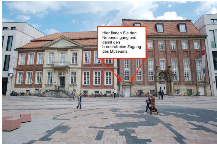
Außenansicht des Museums mit gekennzeichnetem Nebeneingang

Der barrierefreie Eingang des Kunstmuseum Pablo Picasso Münster ist der Nebeneingang (weiße Tür) auf der rechten Seite des Haupteingangs.