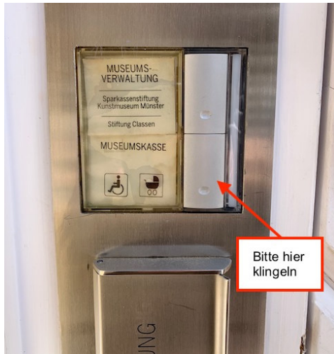
Klingel am Nebeneingang

Drücken Sie bitte auf die Klingel mit der Aufschrift „MUSEUMSKASSE“. Der Kontakt mit der Kasse ist akustisch wahrnehmbar.