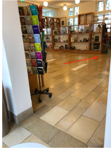
Blick aus Aufzug 1 in das untere Foyer „Kasse/Café“

Sollten Sie in das obere Foyer fahren, um zur Ausstellung zu gelangen, wenden Sie sich unmittelbar nach dem Ausstieg aus dem Aufzug nach links. Geradeaus finden Sie den Aufzug (Aufzug 2), der Sie zur ersten bzw. zweiten Ausstellungsetage bringt.