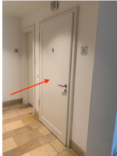
Weg zur barrierefreien Toilette