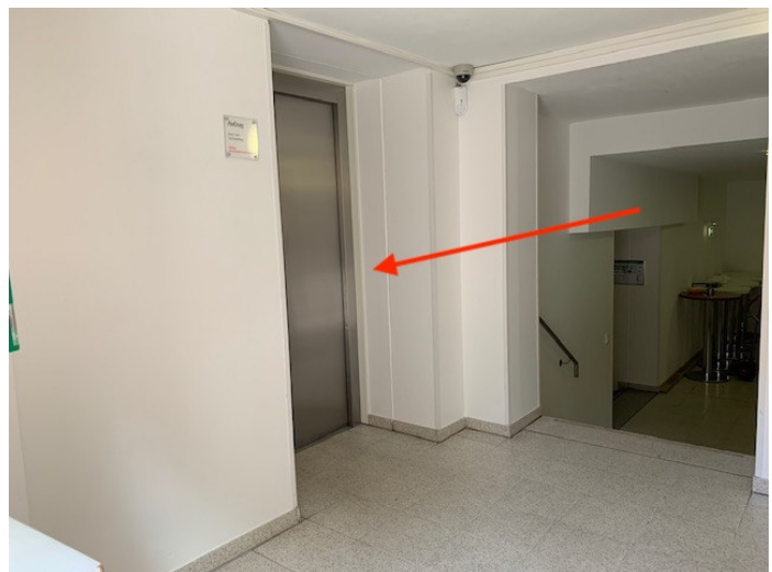
Aufzug 1 auf der linken Seite, um in das Foyer zur Kasse oder zur Ausstellung zu gelangen

Bitte wählen Sie die entsprechende Taste.